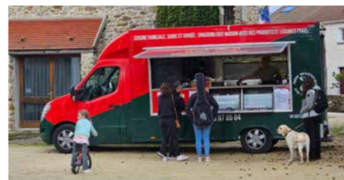
L'après-midi Rosella et ses amies nous ont proposé de belles créations