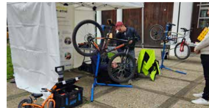
La recyclerie sportive était présente pour nous aider à réparer notre matériel